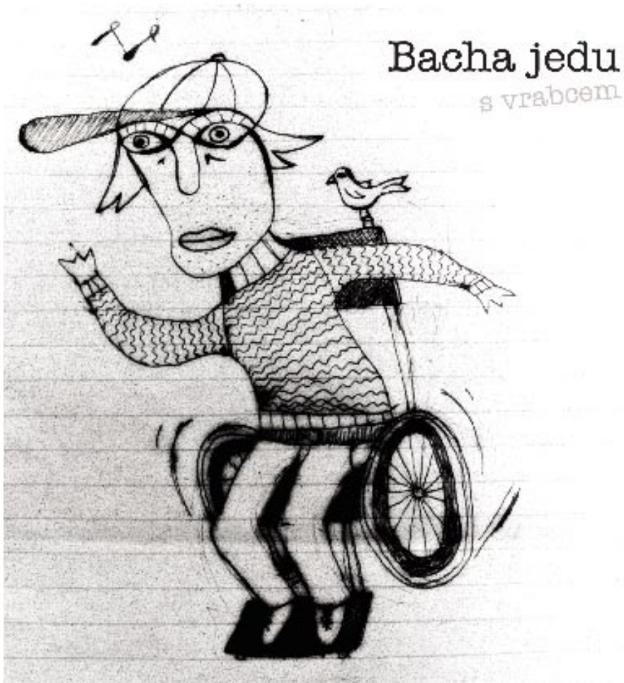
To kreslil Lukáš Hájek z multimédií. Hezký, co?