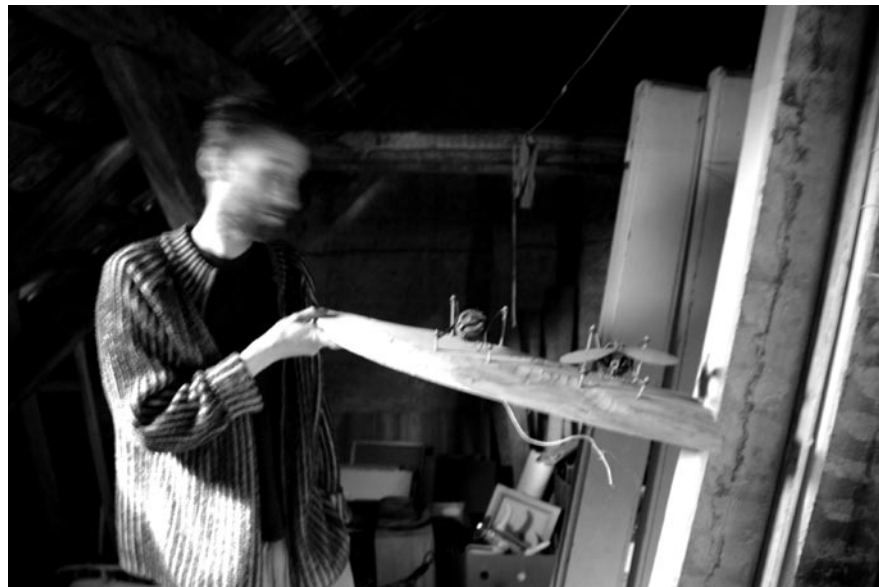
antiprachová polička - součást simulátoru deja-vu 2000